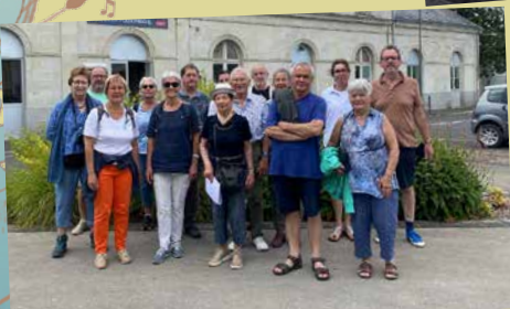
Visite historique avec HCLM