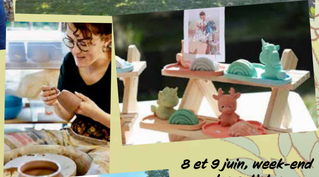
8 et 9 juin, week-end des artistes