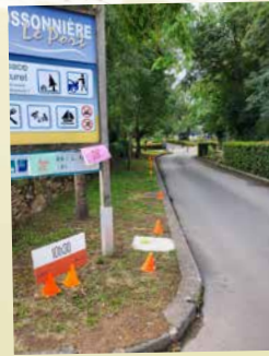
Challenge Boule de fort