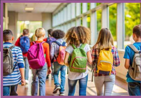
Bonne rentrée à tous !