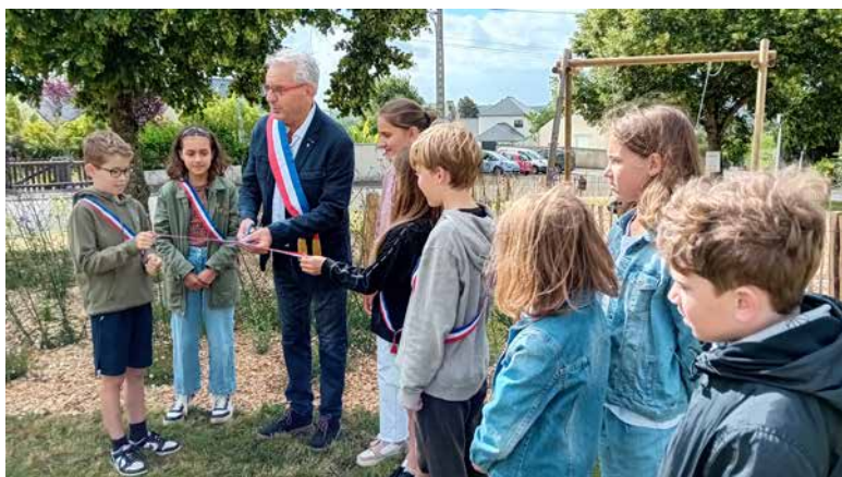
Inauguration du square des Alouettes