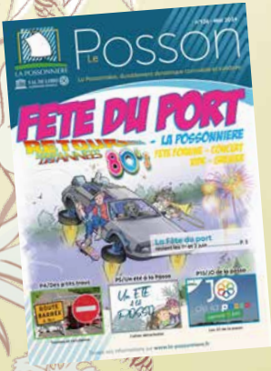
Concert de Jazz