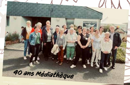
40 ans Médiathèque