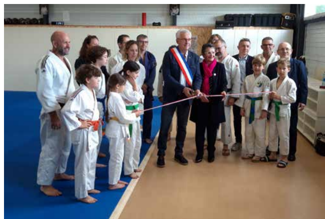
Inauguration du nouveau dojo