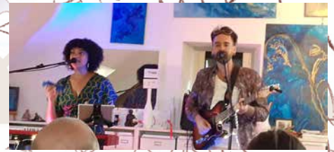
Concert avec "Audrey-K"