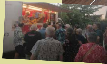
Festival "Jazz à la Posso"