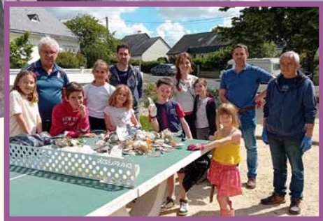
Une journée sous le signe de la rencontre