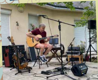
Concert de guitare