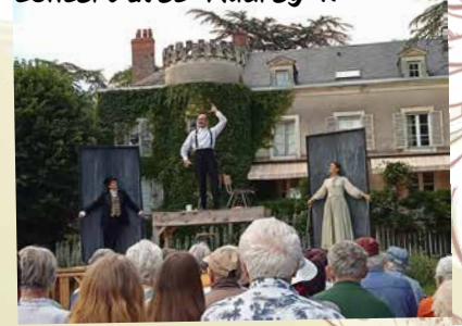
NTP "Une vie Balzacienne"