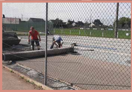
Le terrain de tennis fait peau neuve