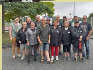
Découverte de la pétanque