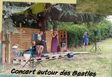
Concert autour des Beatles