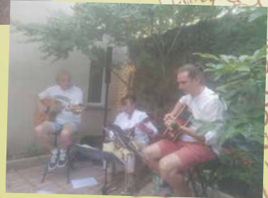
Rencontres musicales "La Lyre"